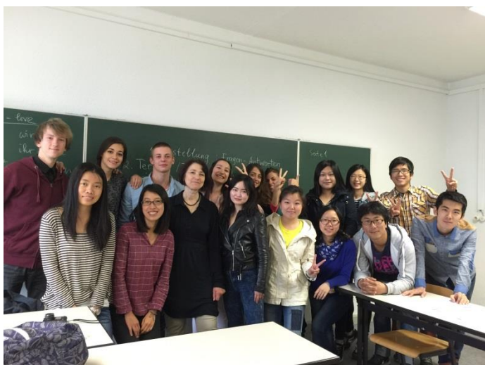
← 多國學生一起修習 A1 德文課程

另外學校提供德語課程讓我們選修，每位學生可以依照自己的德文程度選擇班級，每個學期會有考試來測試我們德文程度並發予證書，但因為學校提供的上課時間並不多，大部分的時間仍要自己花時間研讀，不過因為有了德語環境，也讓自己語言學習上更快進入狀況，還記得一年前看著德國人說話時只能發愣，但在離開德國時已經開始慢慢聽得懂車站月台廣播，或是有辦法聽得懂店員對商品的解說，這樣的成就感讓我更深愛上這個語言跟這個國家。