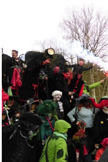
←第一次單獨旅行，參與德國女巫節

在經過幾次與朋友的旅行後，因為一直嚮往能像電影「享受吧!一個人的旅行」中的女主角一樣可以獨自到處旅行，我開始嘗試著自己出遊，一開始先獨自前往德國中部參與每年一次的女巫節，與女巫列車同車廂的德國家庭一起裝扮成鬼怪，一起喝著香檳酒前往森林參加女巫晚會，第一次的三天小旅行雖然緊張，但我發現獨自旅行並沒有想像中困難，而且跟團體出遊比起來，我有更多時間可以好好享受身邊的一切，也因為這個不一樣的體驗讓我開始有信心可以自己完成背包客壯遊的夢想。於 2015 年暑假，我為自己安排一個長達一個多月包括法國、義大利、匈牙利及西班牙的國外旅行，這次旅行花了很多時間做行前準備，但也花了超多時間為自己建立自信心，畢竟要在這麼長的時間獨自前往歐洲治安最差的幾個城市，真的讓我數度想要放棄，但後來在做了所有安全防盜措施及行前功課後我決定去執行，從這次旅遊中我找到屬於自己的旅遊模式，我知道如何在歐洲旅行中遠離危險，我有更多時間與美麗風景以及自己相處，我認識來自各國的旅伴，我認真享受了各地美食與文化，體驗屬於歐洲的浪漫。