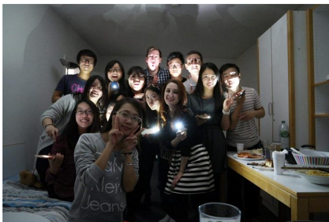
←與中國學生舉辦的美食小聚會，並邀請其他國家同學參與

這一年下來，從原本的不理解、不適應到慢慢習慣、喜歡及融入其中，我也開始學會享受德國人的生活模式，享受這個國家不一樣的地方，享受生活環境為我帶來的改變，我相信這一年的生活絕對為我未來的生活模式帶來重要的影響。