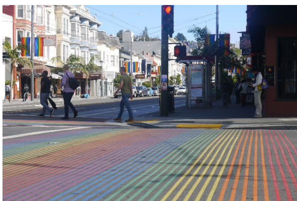
↑ 舊金山卡斯楚是美國著名的同志友善社區

美國廣闊的國土，囊括了各種文化風情與自然景致。在學期之間，主要有四個長假，感恩節連假、聖誕節連假（寒假）、春假（Spring Break）以及暑假。趁著有機會來到美國，深感一年的時間非常短暫，因此努力把握時間在各個假期之間到不同的地方遊覽。因為地大，在美國遊玩的經驗與在台灣差異甚大，開車是必備的技能，衛星導航是不可或缺的幫手，而事前的準備更是學習如何安排假期最好的方式：預訂住宿、租車、查詢該地天氣狀況、安排行程，這些動作看似簡單，但在美國各地風土民情與氣候的差異之下，便是挑戰重重。透過在不同城市、地區的見聞，更可以體會到美國何以成為世界公認的強國：雖然差異大，可是人們願意包容、尊重彼此。