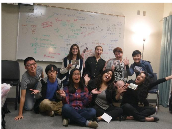
↑最後一堂課後贈與台灣明信片並與同學合影

在美國，學生依照每所學校不同的特性（如：研究型大學或實務型大學），接受相對應的訓練。以 Fresno State 而言，是偏向實務型的大學，因此與碩一時在彰師大輔諮所所訓練相比，做研究、專題的比重少去非常多，課堂的作業幾乎是以學生為主體，刺激學生回到自己的經驗去做反思，與彰師大輔諮所部分著重於個案的研討、針對某特定族群進行專題研究的訓練有很大的差異。比方說，在多元文化諮商的課程中，教授便要求學生撰寫一份關於自己文化背景與身分認同的報告。整體而言，我認為在彰師大輔諮所所訓練強調學生在理論上的精熟度，「成為一位專業的諮商心理師」的成分大於「幫助學生更認識自己」，至於在 Fresno State 的諮商教育則著重一個諮商心理師或助人工作者對自身的理解，以及自己在諮商中的體驗，「先掌握自己，才能幫助別人」、「先感動自己，才能打動個案（這個取向的諮商將是有效的）」。