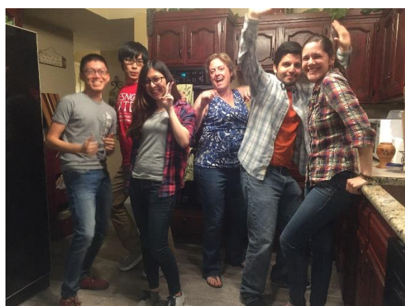
↑課堂之外，也受到 Host Family 的盛情款待