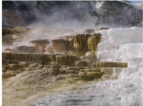
↑黃石國家公園是世界上第一座國家公園