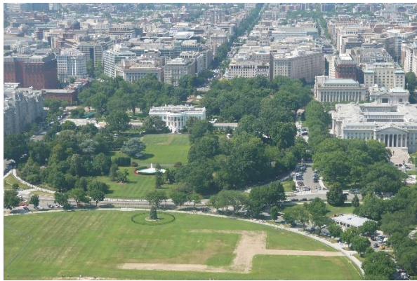
↑從華盛頓紀念碑頂俯瞰白宮及華盛頓街景