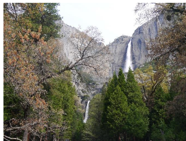
↑ 優勝美地國家公園