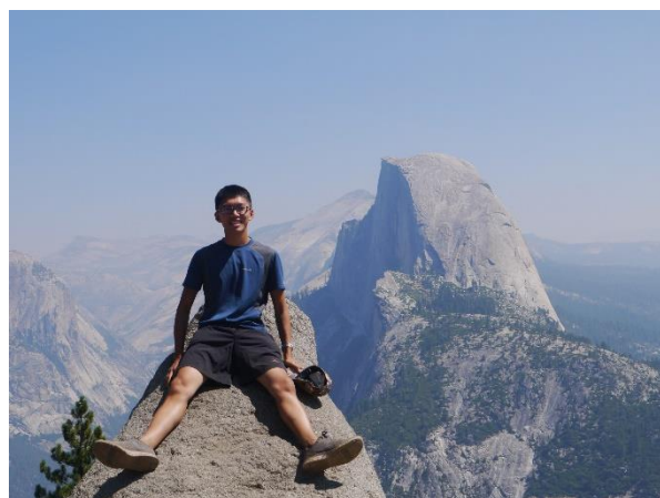
↑ 優勝美地國家公園