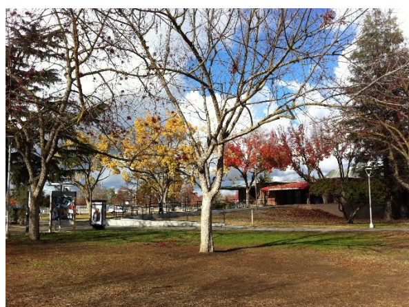
↑ 秋季接近冬季的校園一隅