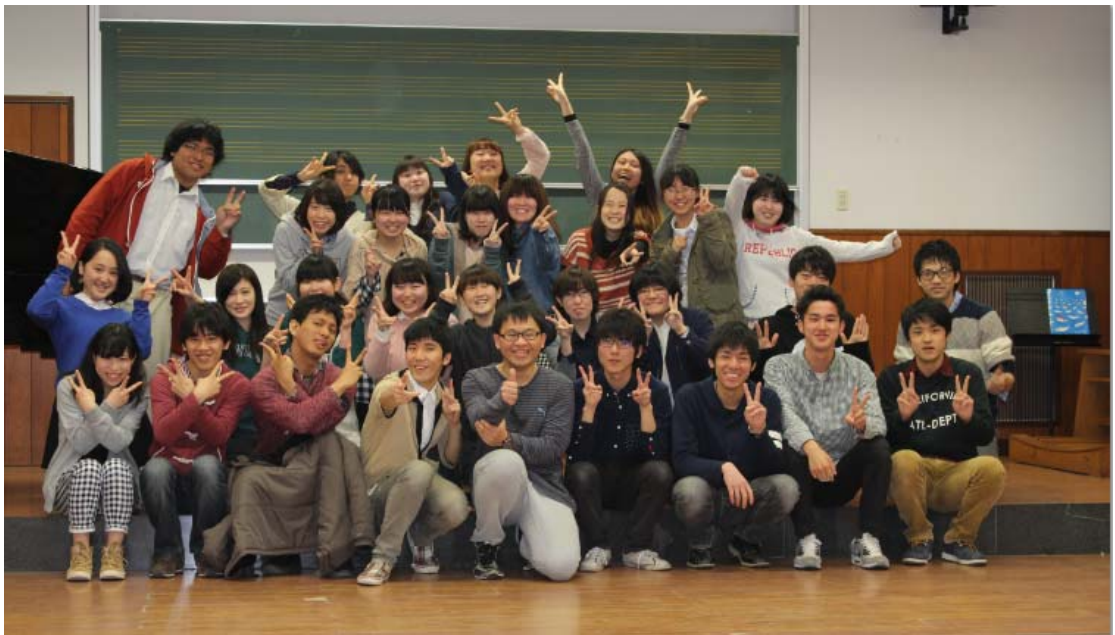
在合唱團的紀念照

人的攻擊進行反擊為主，幾乎不會主動去攻擊人的武術；另外偶爾會到文藝社打擾一下，還記得第一次進到文藝社時看到的那一幕太過衝擊，我看到四個人圍在一起打麻將的景象，不禁懷疑這真的是文藝社嗎？這是一個以各種意義來說相當有趣的社團，話雖如此他們每年都會出幾本刊物，內容是社員所寫的小說。