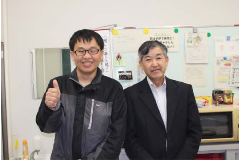
與指導老師的合照

酒會，但是因為我不喝酒，所以全程都是喝零酒精濃度的飲料，過程中大家相互自我介紹，相當有趣，每週除了上課以外會有一個時間與老師見面，談論論文內容與詢問我在日本的生活是否。