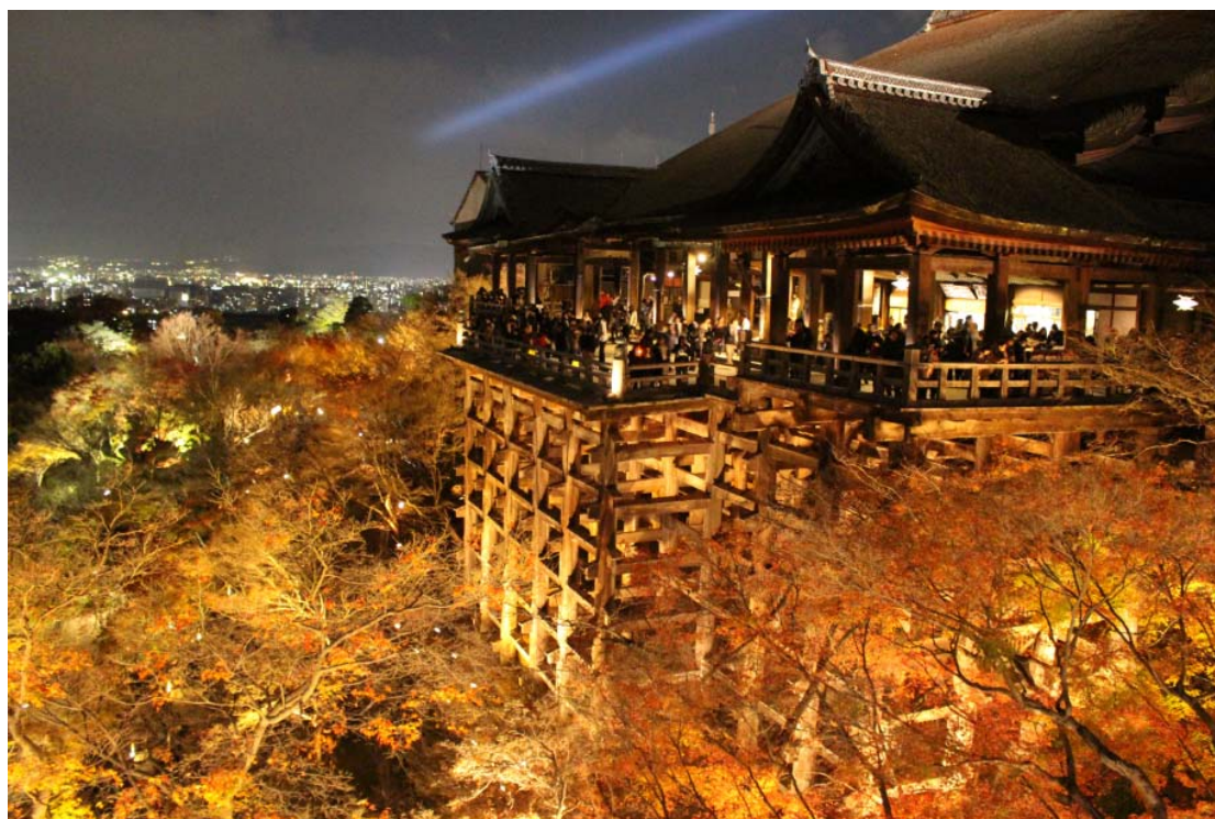
研修旅行時參觀的夜間的清水寺

真得是很特別，另外京都的公車有標示會開往哪些景點，並且車站設有服務台讓觀光客詢問要如何到想去的景點，觀光產業相當發達。