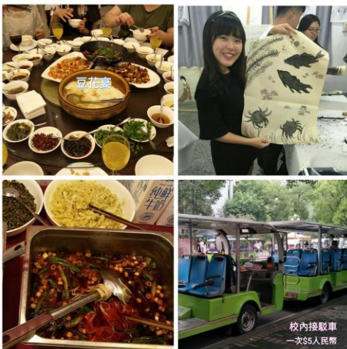
左上到右下依序為：豆花宴、水墨畫體驗、辣麵、校內接駁車(乘坐一次約台幣五元)