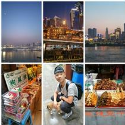
江邊夜景及瓷器口的小吃。