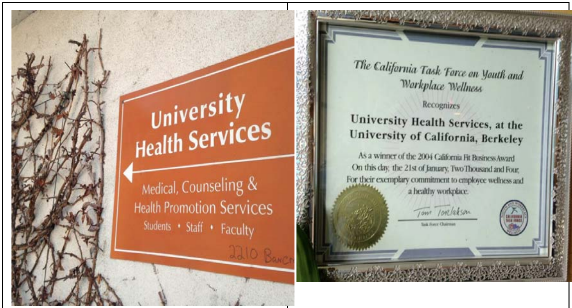
待了一個月的 Berkeley Tang Center