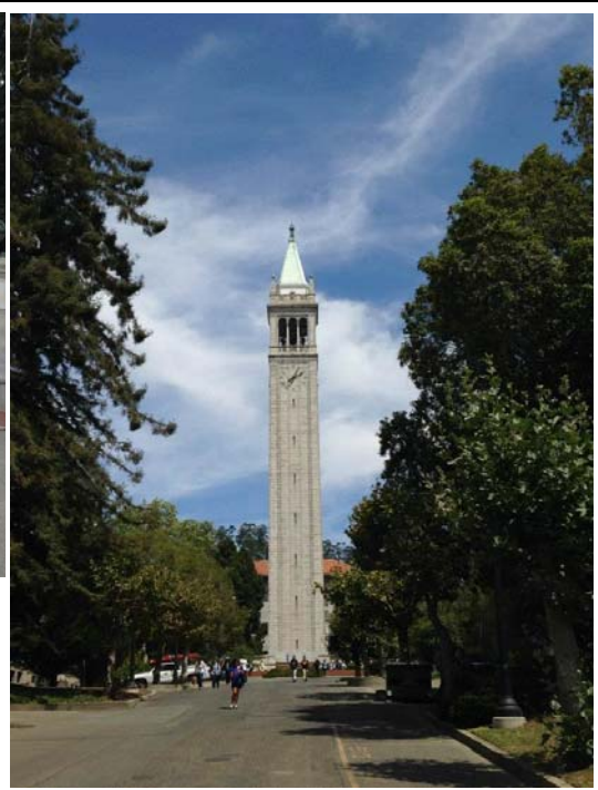
UC Berkeley 地標：Sather gate 與 Sather Tower