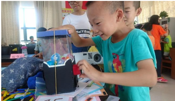
組員很有才，製作了一個非常漂亮的扭蛋機也自己準備了禮物，小朋友們第一次看到扭蛋機玩的超級開心的