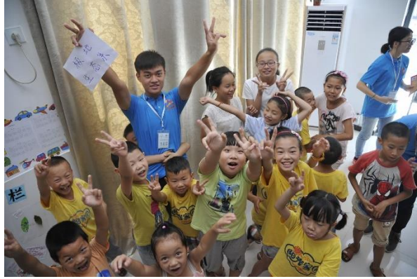
介紹生態系的課程，需要找到我出題目動植物正確的生態系，小朋友們答對後開心地歡呼