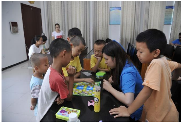
我和小朋友們在下課時間下飛行棋，至於怎麼玩是完全不知道(笑)，反正小朋友們各個都是專家，會在旁邊指導我