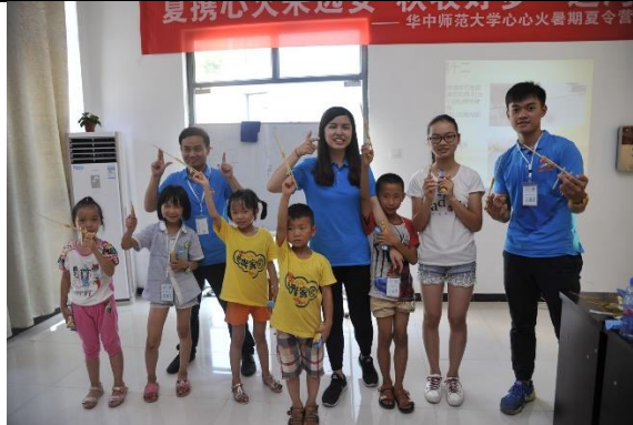
一位組員教小朋友製作竹槍，我們海綿星的小朋友帶著他們的竹槍與海綿老師(我)和章魚哥老師合照