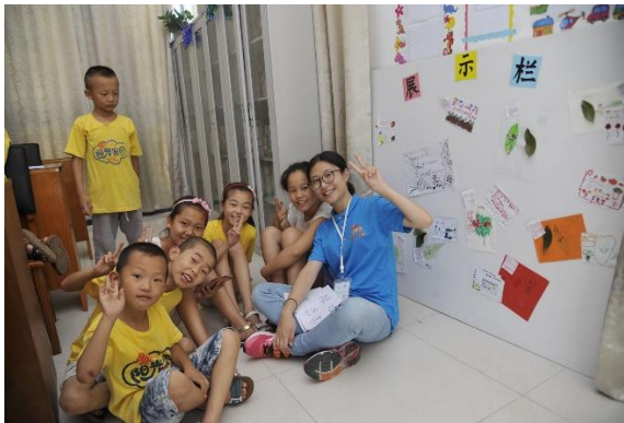
這位就是做扭蛋機有才的組員，就讀台中教育大學，對兒童教育真的有熱忱，支教的幾天從她身上學到很多應對小小孩的方法