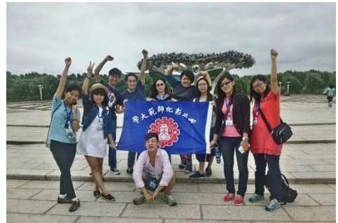
旭日廣場合影(淨月校區)

首先，真的非常感謝彰化師大國際暨兩岸事務處能再次讓我參加這次收穫滿滿的海外夏令營活動。再來，要感謝我們的東師凌老師及所有志願者小夥伴，為了讓我們體驗最道地的東北，特別帶我們去品嚐了當地才有的特色美食，對我們的要求也是盡力滿足，讓我們在這十天九夜的旅途中，能盡情地體驗長春之美。