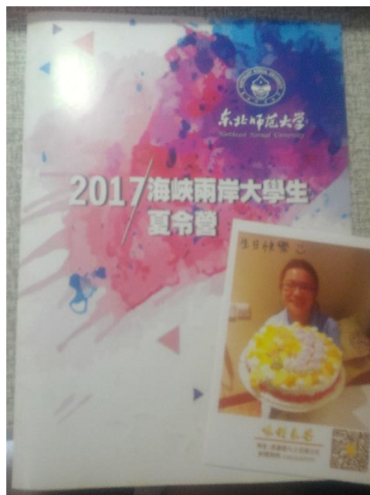
▲活動手冊與生日蛋糕

這次的營火晚未對我來說非常特別，因為活動當天剛好是我的生日，雖然我一直以來都沒有過生日的習慣，但是東師的主辦方非常天新地幫我準備了生日蛋糕一個大驚喜，中途還有一個叫錯人的小插曲，非常有趣，而晚會大概就是講演比賽的延續，大家的表演有是非常即興而有趣的，一群人在飯店房間排練設計 ending pose 大概是做有趣的一件事了。