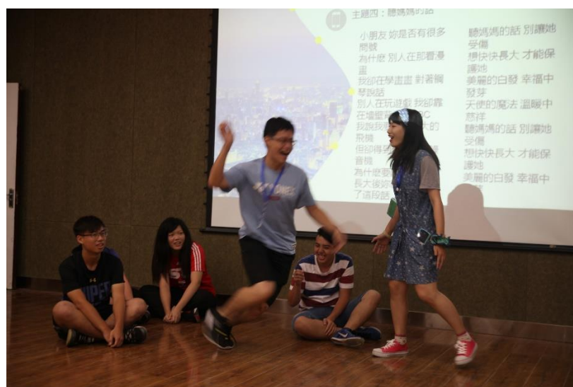
▲講演比賽的即興表演

到了長春的第一時間就看到東師的同學非常熱情地跟我們打招呼，即便我們因為前一天在機場過夜睡的並不是太好以至於有些精神不濟，也被他們的熱情感染再前往飯店的路上不斷地聊著當地的一些特別的風俗和與台灣不同的語言文化。在活動的十天中我體驗到了很多新鮮的東西，其中當然有關於東北文化的介紹，他們除了有安排講座外以帶我們參觀了東北民族博物館、自然博物館、偽滿皇宮博物院和長春便影博物館，讓我們從人文、自然、歷史各方面了解當地的社會，而這些是我們自己當背包客去旅遊的話完全無法深入體會的，除了這些參觀的行程為他們有安排了許多有趣的體驗活動像是剪紙、插花、趣味競賽等，而講演比賽則是讓我們把這些體驗地的文化衝擊用舞台的形式表現出來，這次的組員除了有同校同學之外還有來自東華、東吳和淡江的同學，雖仁我們都是第一次見面但是在第三天的講演比賽中有非常好的合作，這應該是因為大家都放得很開不濟形象表演的關係，有這麼好的組員也讓這次的活動體驗特別的有趣。